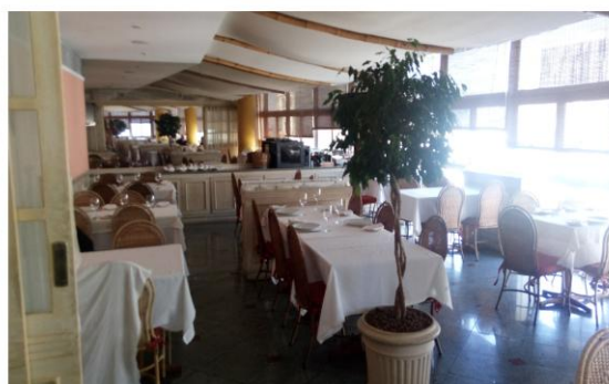
FOTOS DO RESTAURANTE ASPARGUS, LOCAL DA CONFRATERNIZAÇÃO