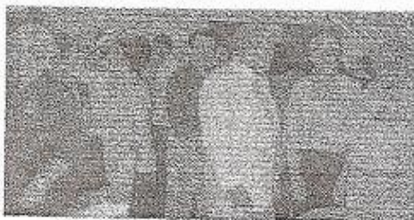
COLUNA DO ASSOCIADO

Após cumprida as formalidades, foi servido um pequeno coquetel, o qual, como sempre acontece, tornou-se um evento de confraternização